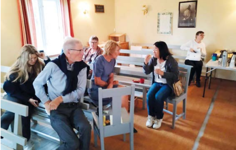
Hyggelig med kirkekafe og samtaler i benkene

Når været tillater det, pleier kirkekaffen å foregå ute på tunet. Da pleier deltakerne å ta med seg stoler og/eller campingbord. Som regel blir det også lagt ned blomster på minnestøtten som står ved kirkestua. Av forskjellige grunner skjedde ikke det denne gangen.